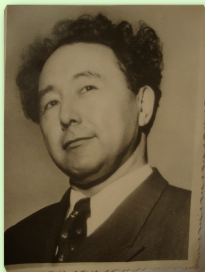
Бабаходжаев А.Х. Вестник архивиста, 2012, № 2.