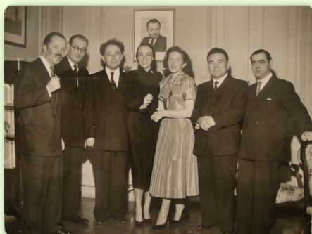
На приеме во время V Ассамблеи ООН. Вестник архивиста, 2012, № 2.