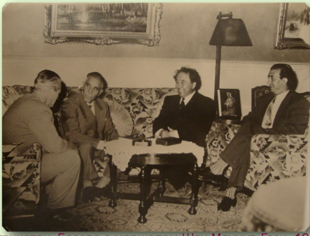
Афганистан. Беседа с маршалом Шах Махмуд Гази. 1958 г. Вестник архивиста, 2012, № 2.